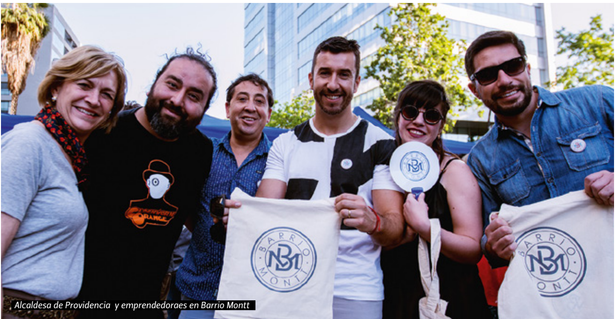
Alcaldesa de Providencia y emprendedoras en Barrio Montt