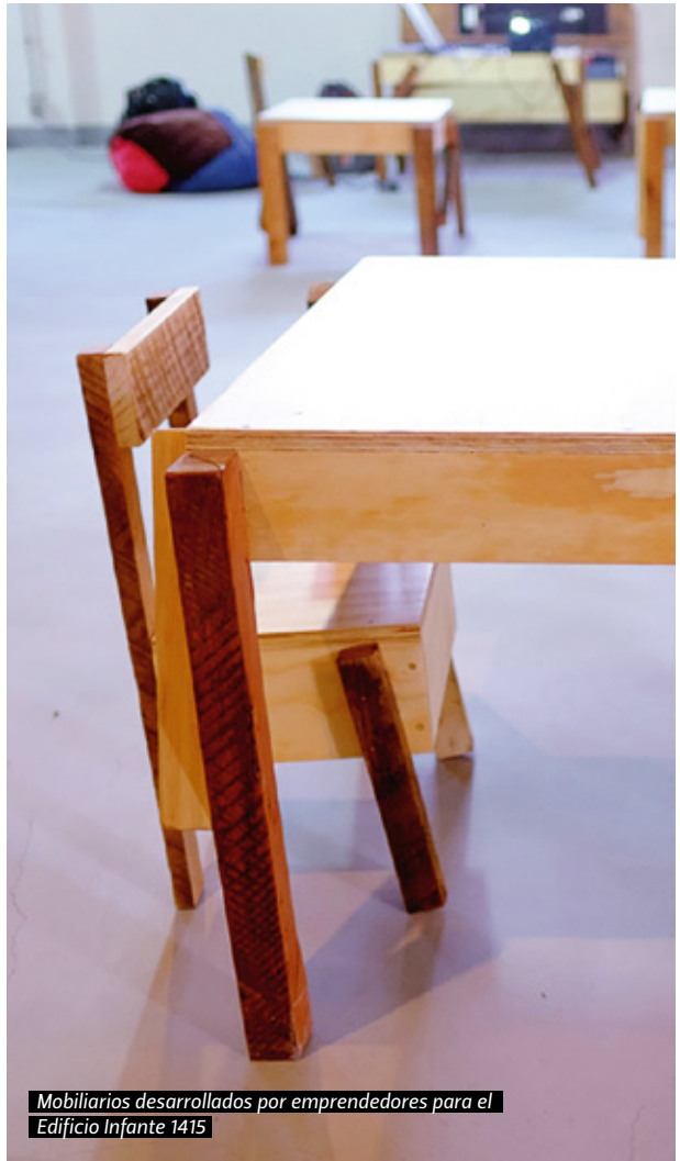
Mobiliarios desarrollados por emprendedores para el Edificio Infante 1415