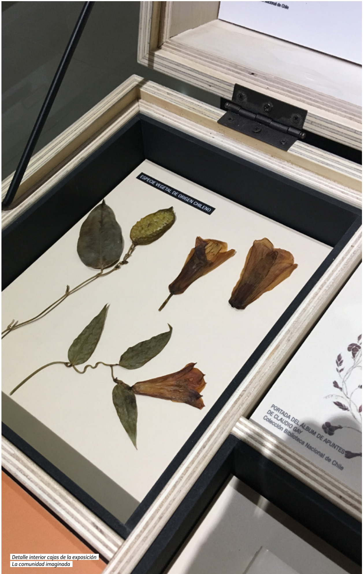
Detalle interior cajas de la exposición La comunidad imaginada