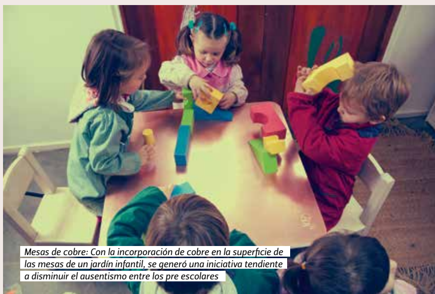
Mesas de cobre: Con la incorporación de cobre en la superficie de las mesas de un jardín infantil, se generó una iniciativa tendiente a disminuir el ausentismo entre los pre escolares

ALMACENAMIENTO DE ENERGÍA TÉRMICA: La tecnología térmica basada en hielo ha demostrado ser efectiva en la demanda de energía eléctrica con pausa en directo en sistemas de aire acondicionado.