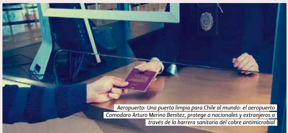
Aeropuerto: Una puerta limpia para Chile al mundo: el aeropuerto Comodoro Arturo Merino Benítez, protege a nacionales y extranjeros a través de la barrera sanitaria del cobre antimicrobial

Systems are being developed that use phase shifting materials with several energy density times of the water/ice systems. The compact devices for thermal energy storage of phase shifting with copper heat exchangers can be integrated to geothermal, water heating, solar thermal and other systems to reduce the cost of the system and increase energy efficiency. In the same way as in an electric battery, these devices can be loaded or unloaded at different values.