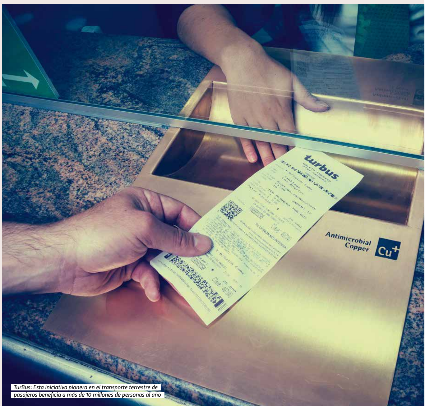
TurBus: Esta iniciativa pionera en el transporte terrestre de pasajeros beneficia a más de 10 millones de personas al año