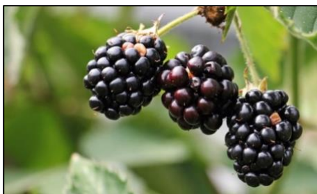
Figura 2. Fruto de mora.

productos procesados como jaleas, mermeladas, jugos y postre. Una excelente alternativa de incorporarlos como ingredientes en preparaciones alimenticias es en forma deshidratada, debido a su estabilidad y fácil manejo en el producto. La liofilización es la mejor opción para su deshidratación, y se ha comprobado que estos se mantienen aún después de la deshidratación del fruto, lo cual corresponde a un importante beneficio a la hora de la elaboración de un producto horneado, como el desarrollado en el presente estudio 5 .