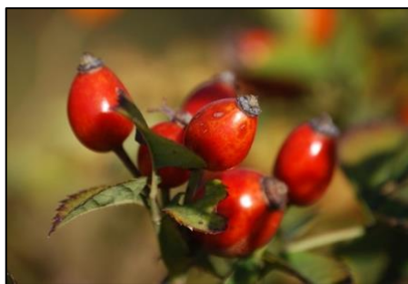
Figura 1. Fruto de rosa mosqueta.

En la industria de alimentos, es utilizado como un pigmento alimenticio, y gracias a su presencia de ácidos orgánicos, especialmente el cítrico, se puede utilizar como conservante y agente antimicrobiano. De igual manera, se utiliza como aditivo antioxidante, debido a la presencia de tocoferoles en su composición, los cuales además se relacionan con la disminución del riesgo de ciertas enfermedades. Adicionalmente, es utilizada como remedio natural para tratar diarreas o resfriados 2 . La rosa mosqueta es utilizada para la elaboración de diversos productos, como mermeladas, jugos, infusiones, gelatinas y licores, entre otros. También puede consumirse fresca, sin embargo, se recomienda utilizarla en preparaciones con adición de azúcares, para mejorar su sabor 1 .